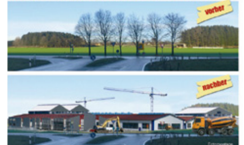
Bild oben: Freie Sicht adé - die Fotomontage unten zeigt, wie das Gewerbegebiet die Wohnqualität in Rohrdorf unwiderruflich verändern würde.

Kein Neubeurer Gewerbegebiet im Landschaftsschutzgebiet an der Ortsgrenze von Rohrdorf!